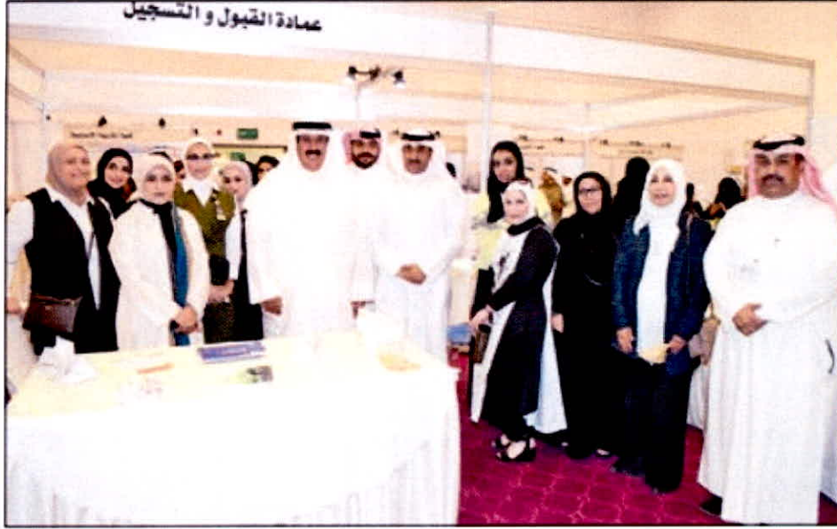
• جانب من المشاركين في معرض القبول والتسجيل الأول