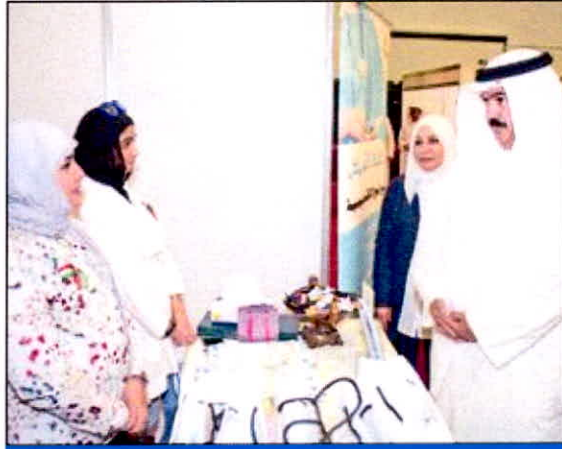
المضيف والنجاحة خلال الجولة في المعرض

النجاح: ضرورة توعية الطلبة بتخصصات قطاعي الهيئة