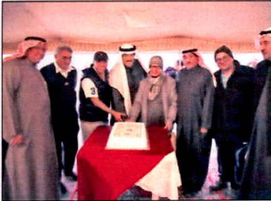
قطع كعكة الاحتفال