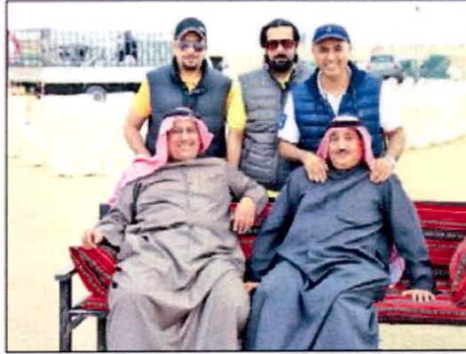
عدد من المشاركين في المخيم الربيعي